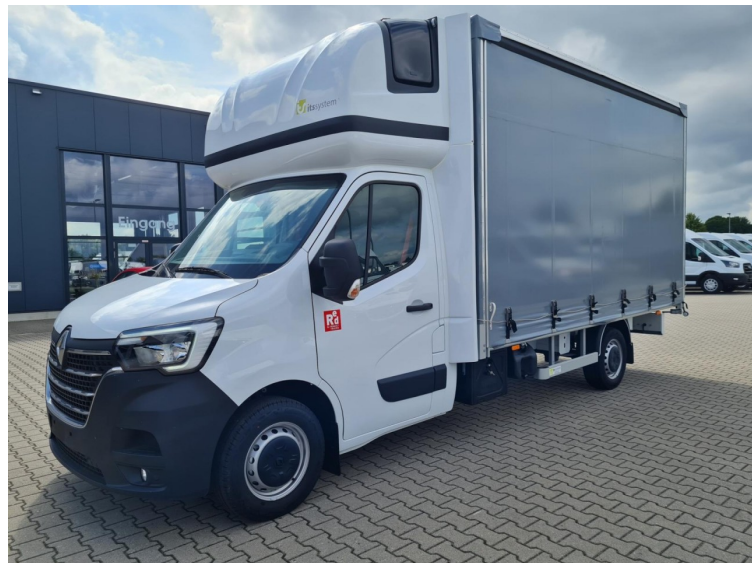
Plate-forme + bâche moins de 7,5 t, 2, Avec historique complet, Inscription temporaire, accident free