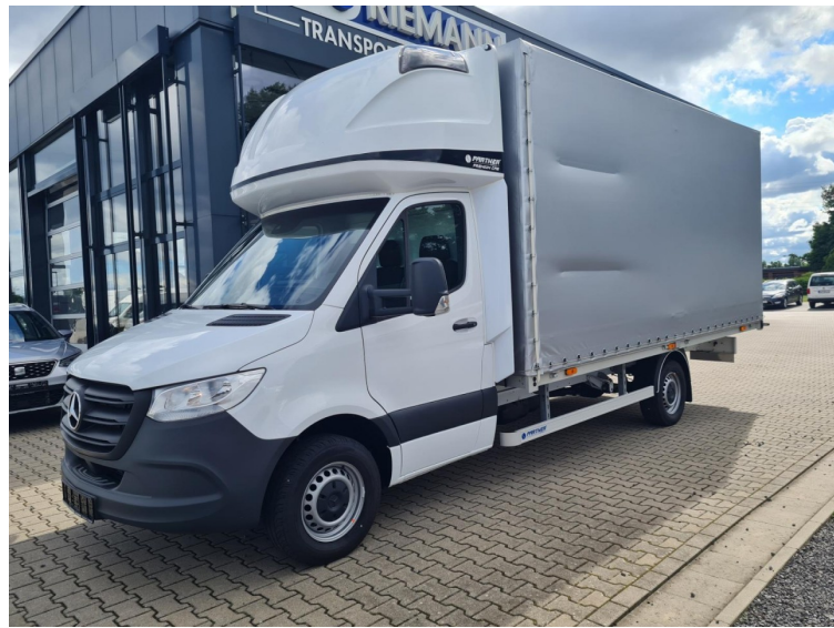
Plate-forme + bâche moins de 7,5 t, 2, Avec historique complet, ARKTIKWEISS, accident free